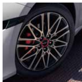
Cerchi in lega da 18" GT

Le informazioni relative agli pneumatici inerenti i consumi e altri parametri ai sensi del Regolamento UE 2020/740 sono disponibili sul nostro sito, all'indirizzo https://www.kia.com/it/ . Le informazioni riportate sugli pneumatici hanno puramente carattere informativo.