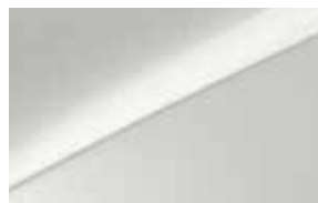
Deluxe White (HW2)