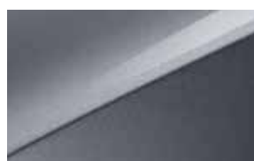
Lunar Silver (CSS)