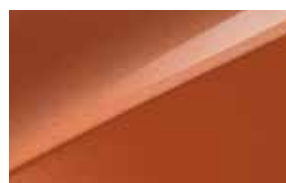
Orange Fusion (RNG) Disponibile solo per GT Line e GT