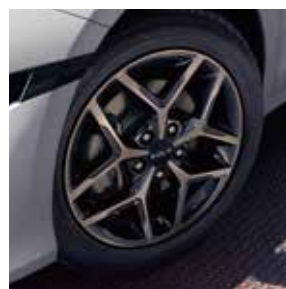
Cerchi in lega 17"