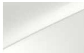
Cassa White (WD) Non disponibile per GT

Colora il tuo mondo con creatività. Definisci il tuo stile con carattere. Lasciati ispirare da Kia.