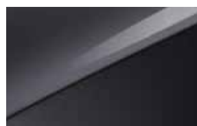
Penta Metal (H8G)