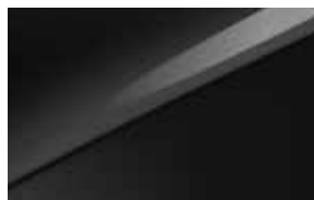
Black Pearl (1K)