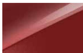
Infra Red (AA9)