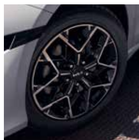
Cerchi in lega da 17" GT Line